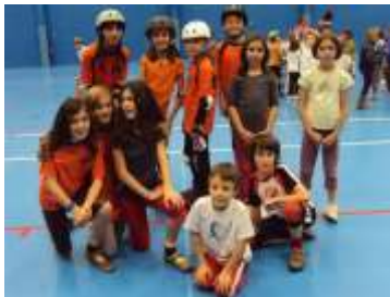
Le groupe des patineurs du RCP