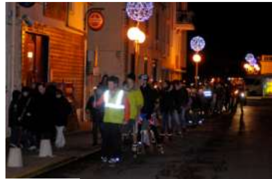
Descente aux flambeaux 2010